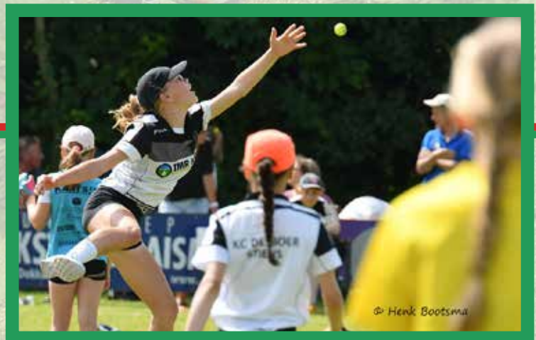
JUBILEUMWEDSTRIJD HIEL FRYSLAN KEATST